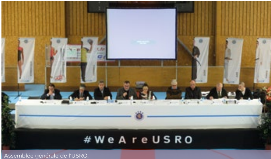
Assemblée générale de l'USRO.

2016 : année sportive par excellence ! Espérons que l'année Olympique portera les sportifs Rissois vers de nouveaux rêves, de nouveaux objectifs ou de nouvelles disciplines. Avec une nouvelle identité pour notre association, cette nouvelle année démarre sur une note positive.